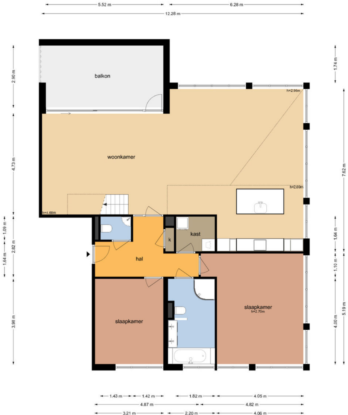
Nijlstraat 60 - Purmerend Derde Verdieping

De plattegronden zijn geproduceerd voor promotionele doeleinden en ter indicatie. Aan de plattegronden kunnen geen rechten worden ontleend © www.objectenco.nl